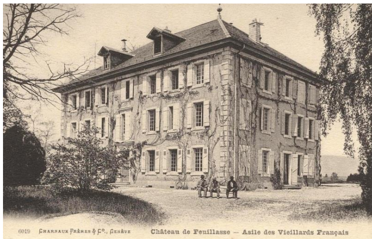
Le Château de Feuillasse – Asile des Vieillards Français. Carte postale des Frères Charnaux, vers 1910