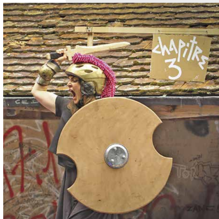
L'Odyssee d'Alysse @ Cie Alsand

Tous les sujets sont bons pour le Professeur Van de Fruüt! Sa connaissance sans limite fait de lui un guide surprenant dans le monde insondable des énigmes de la vie. Une voltige à l'issue incertaine, une création participative : un cours particulièrement particulier qui pousse le public à s'interroger sur les sujets les plus improbables. Un spectacle d'aléas légèrement abscons un peu imprévu un tantinet absurde un brin décalé et peut-être... un rien instructif!