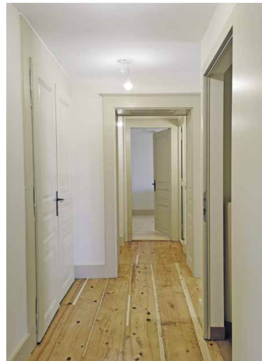
Intérieur du logement