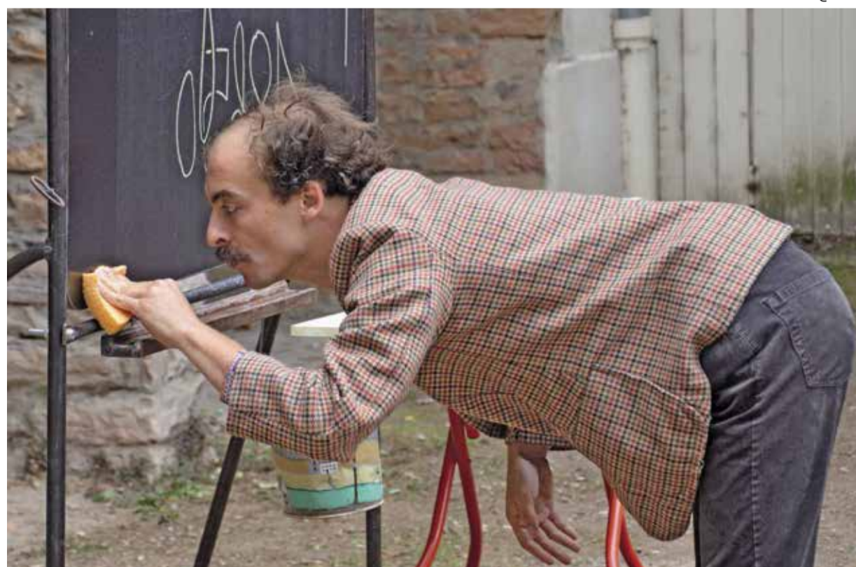
Professeur Van de Fruüt @ SIKO

Dans le cadre de Meyrin-les-Bains, derrière Meyrincentre meyrinlesbains.ch / meyrinculture.ch