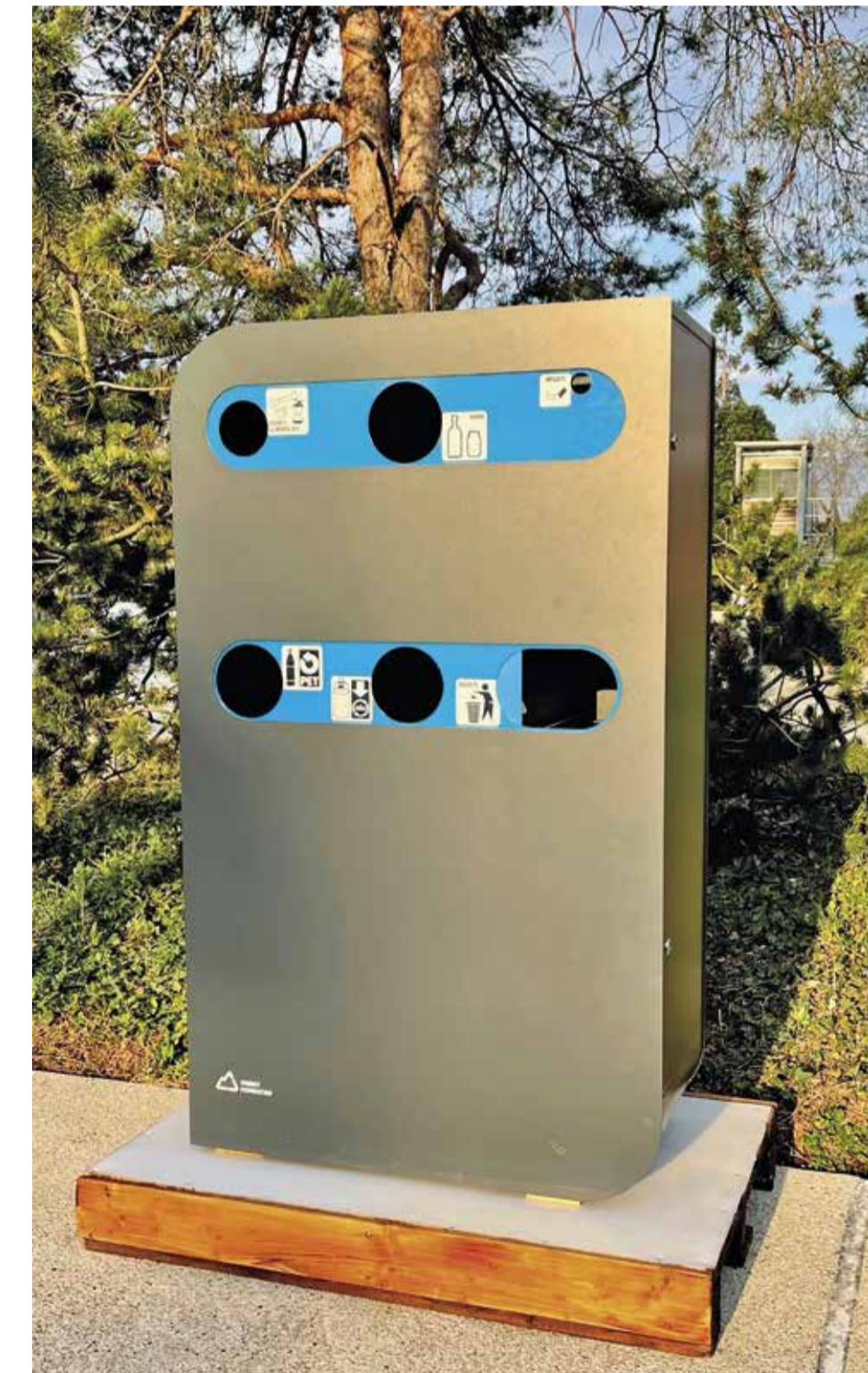
Les nouveaux points de collecte

Ces différentes mesures vont certes imposer un changement des habitudes de tous les utilisateurs du site. Mais notre objectif est d'augmenter de 30% le tri des déchets à la piscine des Vergers. Compte tenu des autres mesures prises cette année pour les usagers de la piscine, ces changements se feront progressivement en cours de saison. Etes-vous prêts à nous aider à relever ce défi ?