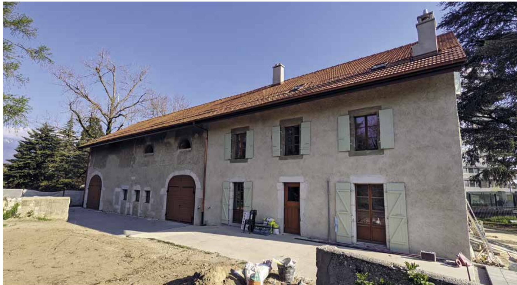
Vue extérieure de la ferme

Précieux bâtiment communal – tant par son histoire, son architecture que sa fonction – la ferme de la Planche s'offre une nouvelle jeunesse à l'aube de son bicentenaire. Elle abritera la coopérative qui œuvre pour l'entretien et le maraîchage du quartier des Vergers. Explications