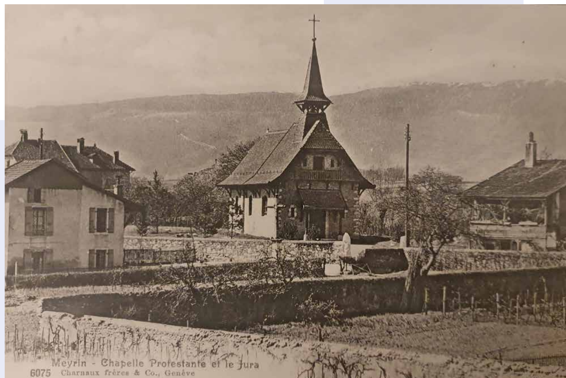
La chapelle protestante en 1913. La Tribune de Genève, 16.05.1911