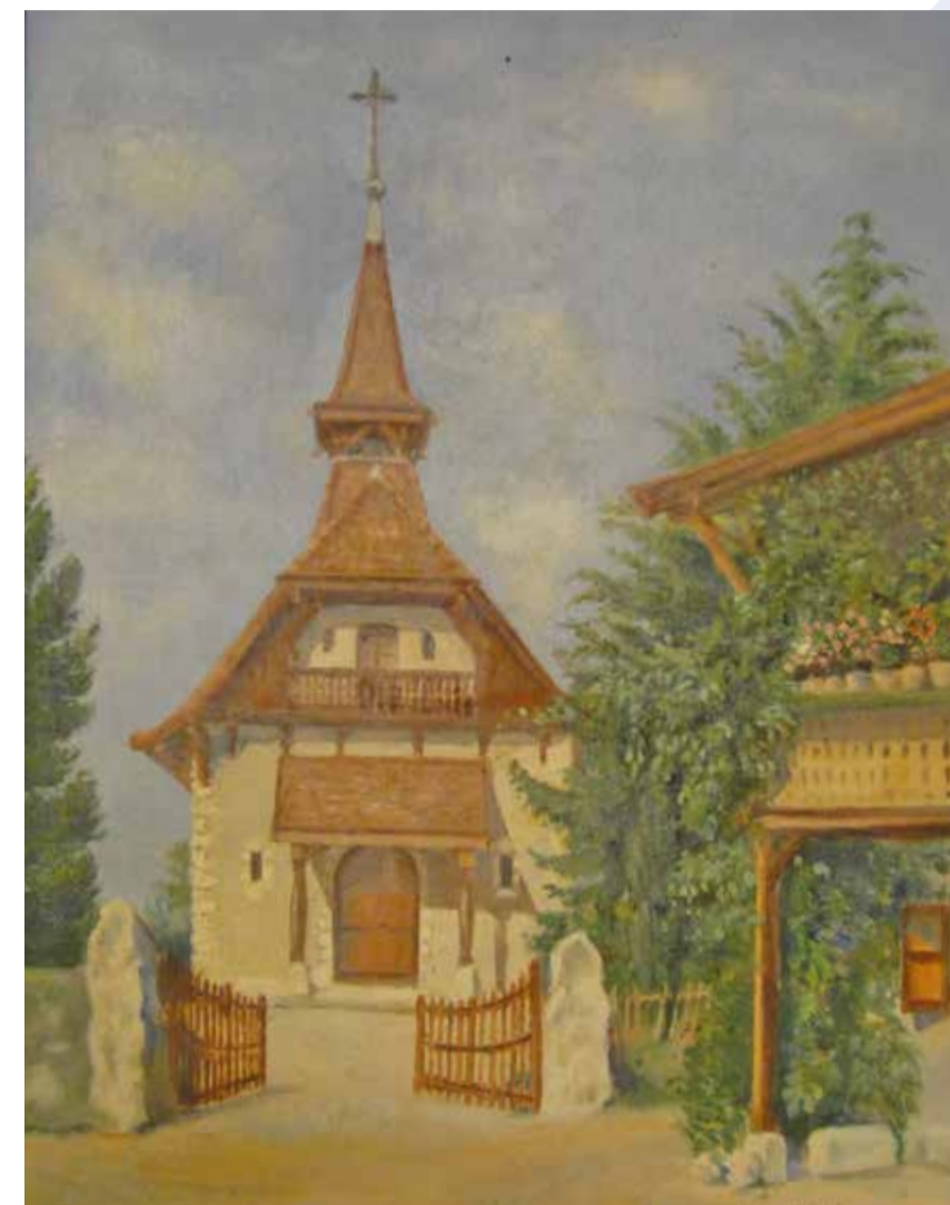
Peinture de la chapelle par Jacques Bourquin, qui en est également l'auteur des plans. Vers 1911. ACM.

En raison de son appartenance à la France jusqu'en 1816, Meyrin était une commune à majorité catholique. Les protestants meyrinois, pas assez nombreux pour y posséder un lieu de culte, devaient se rendre à Satigny, puis à Vernier dès 1837, date de la construction de la chapelle protestante de ce village. En 1900, on recensait à Meyrin 260 protestants parmi les 856 habitants, soit environ 30% de la population.