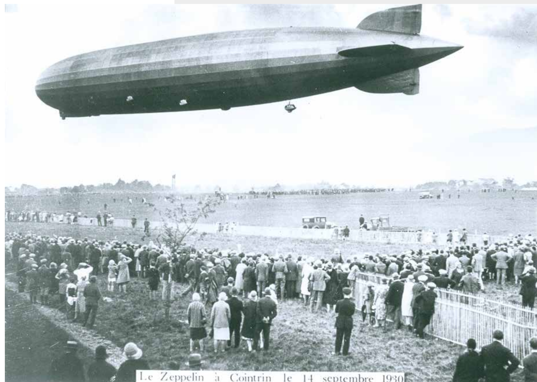
Le Zeppelin à Cointrin le 14 septembre 1930