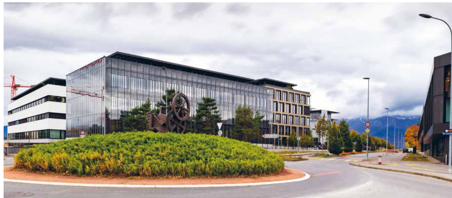
La Zimeysaver s'est bien développée ces dernières années