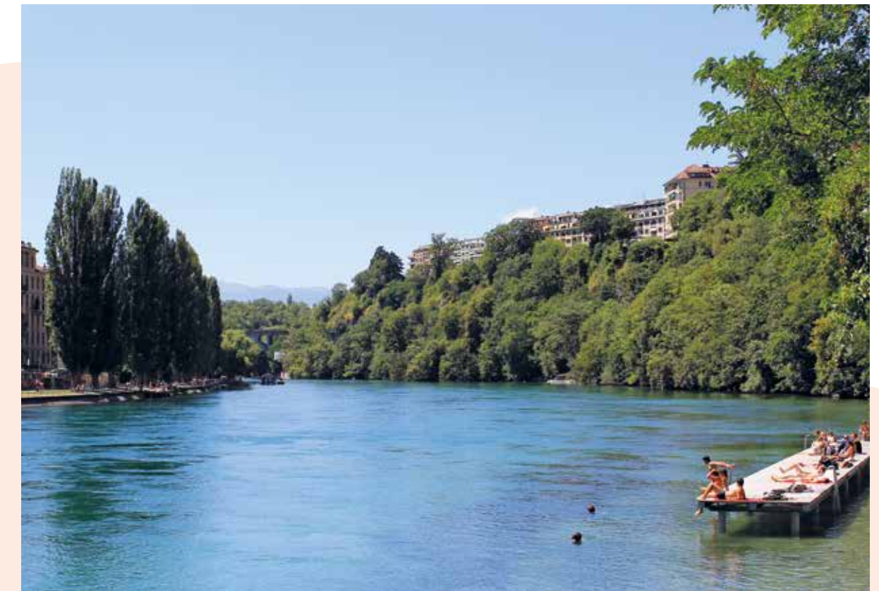
Le Rhône du côté des falaises de St-Jean, où les plateformes permettent un accès à l'eau.

En plus du majestueux Léman qui offre plus de 35 accès à l'eau, notre canton compte plus de 300 kilomètres de cours d'eau. Une bénédiction pour la faune et la flore, le paysage ou les loisirs. Des ressources toutefois fragiles qu'il convient de protéger. Voici quelques conseils pour les Meyrinoises et Meyrinois qui souhaitent se baigner.