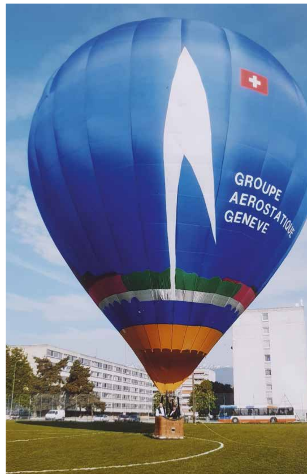
Le ballon captif à Meyrin lors de PhilAéro '09, avril 2009.

Le 12 septembre 1847, le Français Jean Eugène Poitevin s'élève dans le ciel genevois avec sa montgolfière nommée L'aigle audacieux, avant de se poser quelques heures plus tard près de Meyrin. C'est le premier vol en ballon avec passager dans le canton.