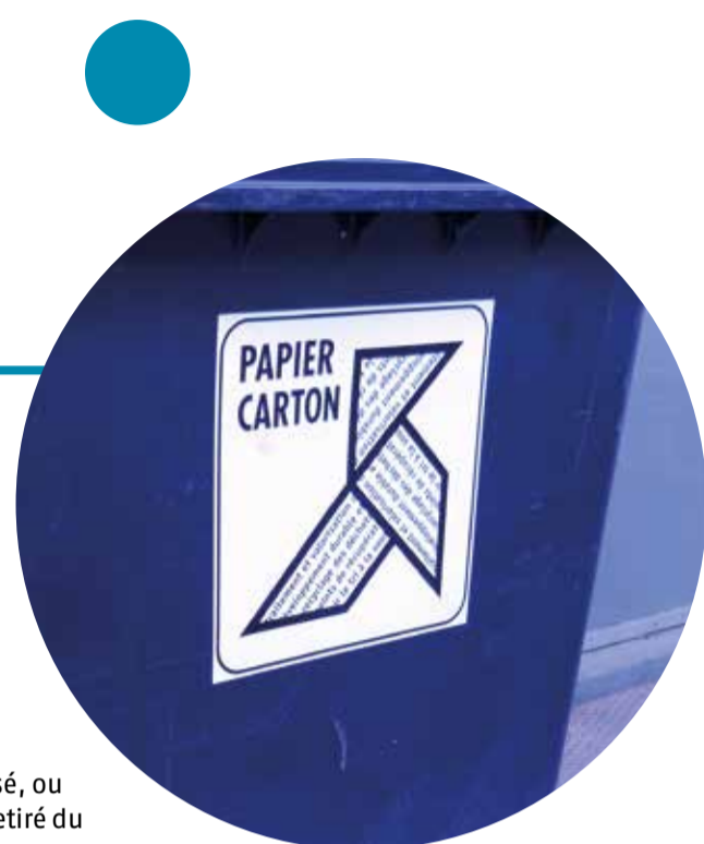
© MHM55, CC BY-SA 4.0 via Wikimedia Commons