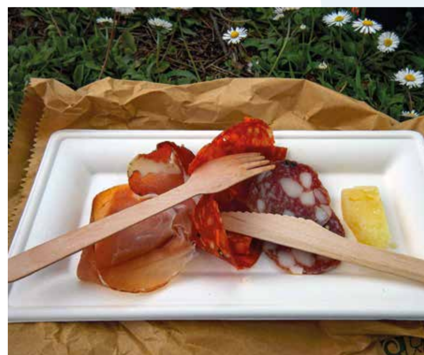
Le papier ou carton souillé par la nourriture ne peut être recyclé.