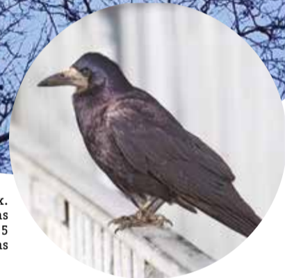
Corbeaux Freux. Rook-Corvus frugilegus