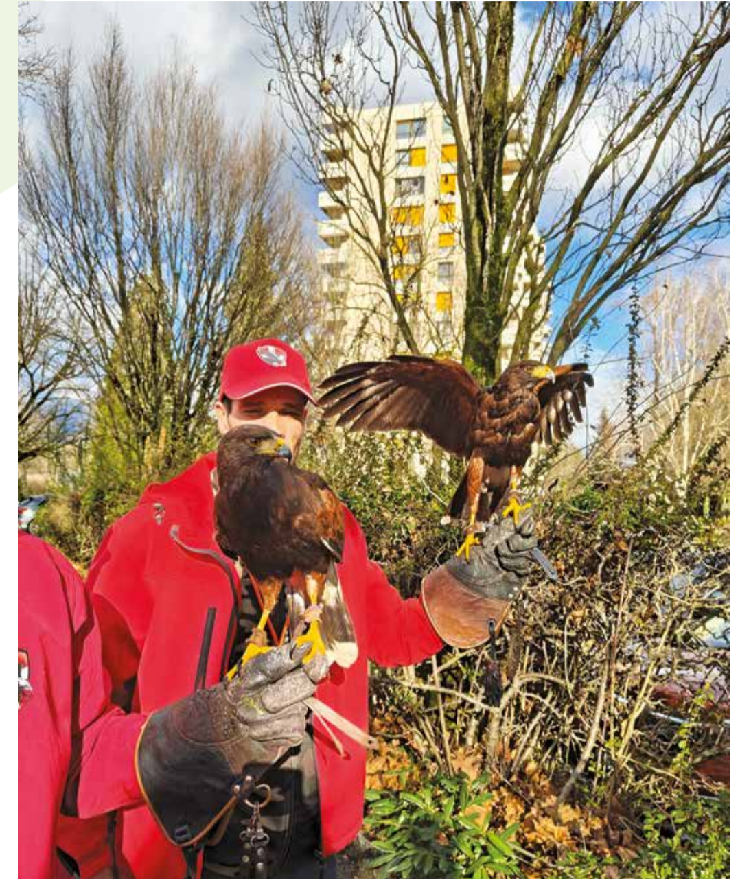
Ares et Césars, deux buses Harris