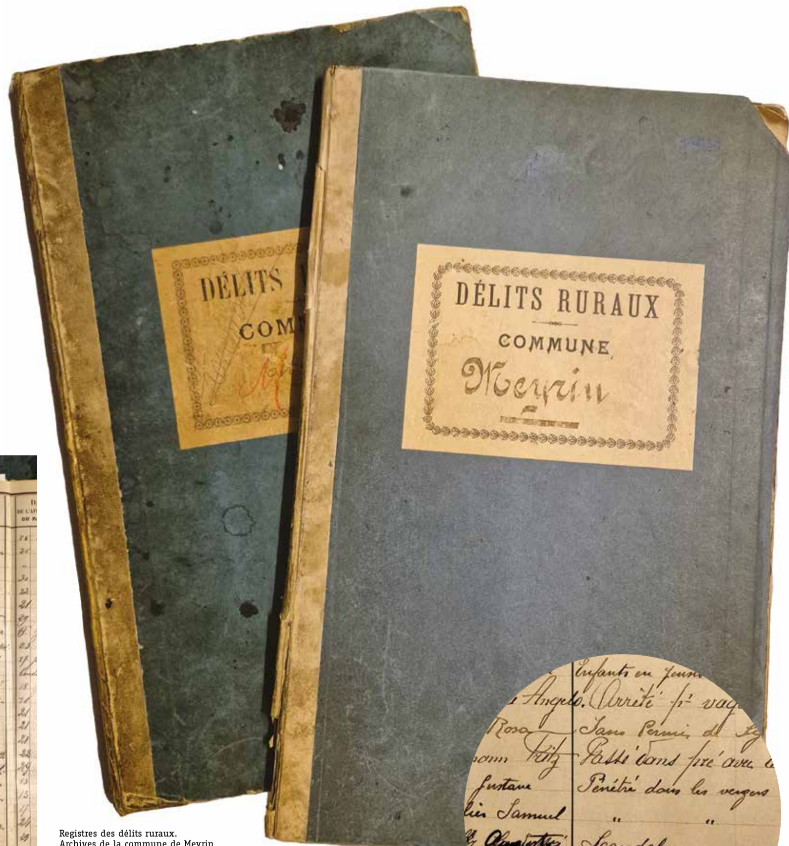
Registres des délits ruraux. Archives de la commune de Meyrin