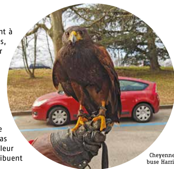
Cheyenne, buse Harris

chez les corbeaux, ces derniers cherchant à les chasser. Cependant, les buses de Harris, plus robustes, ripostent et montrent leur supériorité, ce qui finit par intimider les corbeaux. Le faucon, plus agile et rapide, est un prédateur naturel des corbeaux. Cependant, sa présence dans les zones denses en arbres est limitée, car ces derniers gênent ses déplacements. L'objectif de ces interventions n'est pas de blesser ou tuer les corbeaux, mais de leur faire comprendre que l'environnement n'est pas propice à leur installation. En modifiant leur perception du territoire, ces rapaces contribuent à éloigner progressivement les colonies.