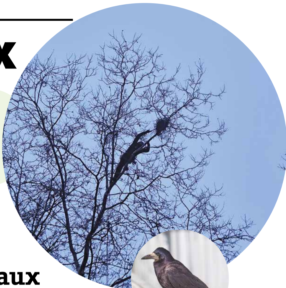
Corbeaux Freux. Rook-Corvus frugilegus

Suppression de nids de corbeaux freux