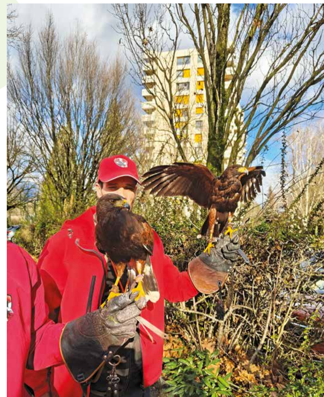
Ares et Césars, deux buses Harris