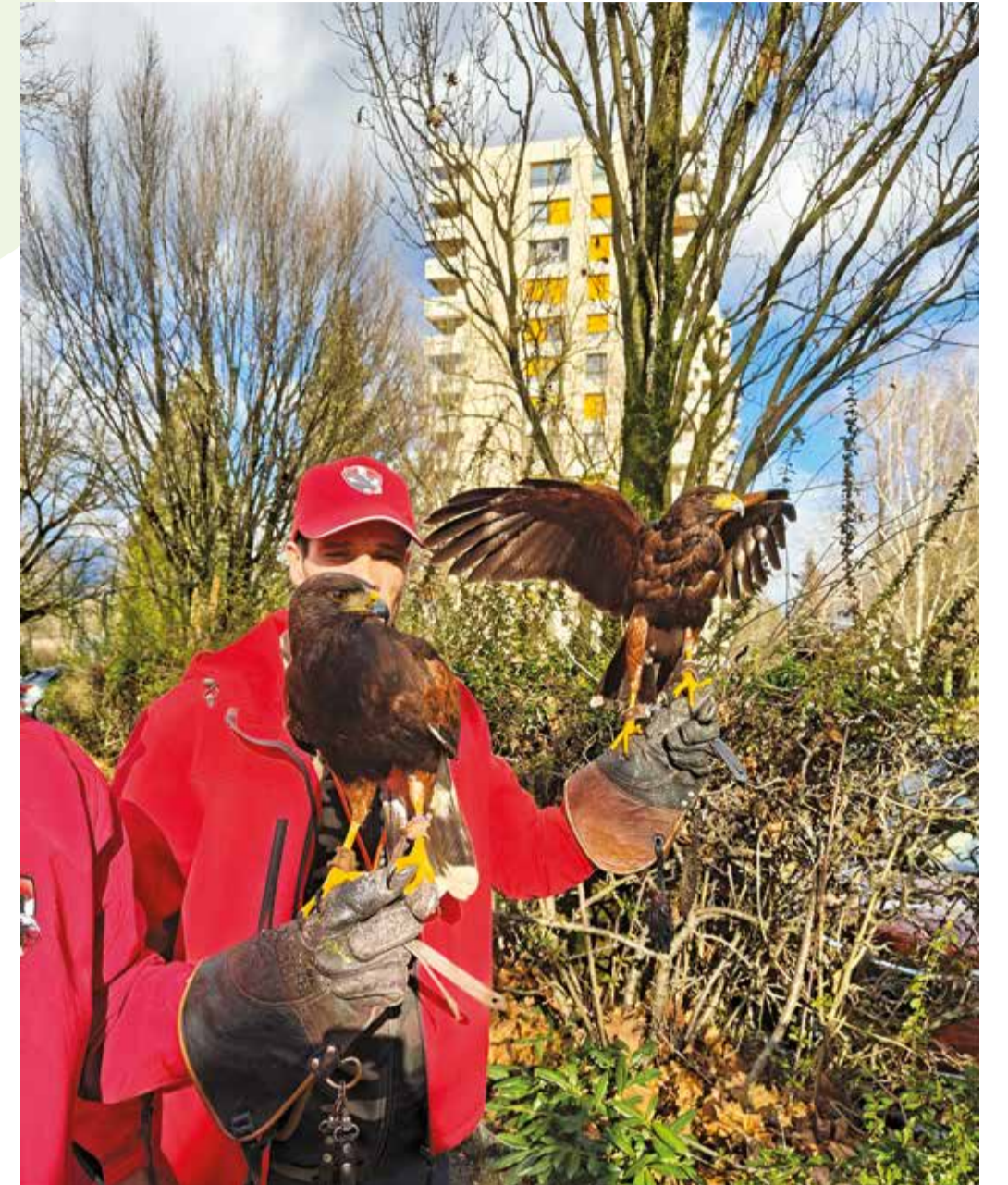
Ares et Césars, deux buses Harris