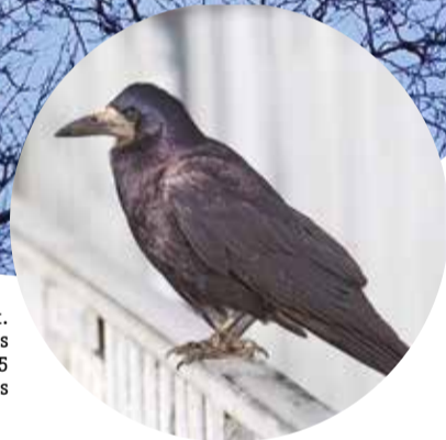
Corbeaux Freux. Rook-Corvus frugilegus