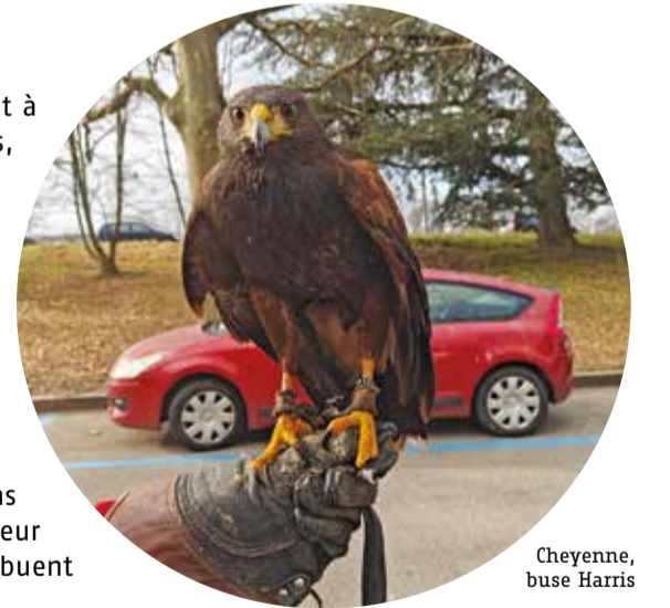
Cheyenne, buse Harris

chez les corbeaux, ces derniers cherchant à les chasser. Cependant, les buses de Harris, plus robustes, ripostent et montrent leur supériorité, ce qui finit par intimider les corbeaux. Le faucon, plus agile et rapide, est un prédateur naturel des corbeaux. Cependant, sa présence dans les zones denses en arbres est limitée, car ces derniers gênent ses déplacements. L'objectif de ces interventions n'est pas de blesser ou tuer les corbeaux, mais de leur faire comprendre que l'environnement n'est pas propice à leur installation. En modifiant leur perception du territoire, ces rapaces contribuent à éloigner progressivement les colonies.