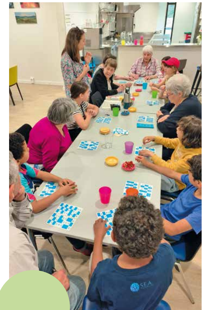
Un loto intergénérationnel au Jardin de l'Amitié

Samedi 12 octobre de 9h à 12h Pour les 0-4 ans, accompagnés Gratuit et sans inscription Chez Gilberte – la maison meyrinoise Rue de la Prulay, 2bis – Gilbert centre meyrin.ch