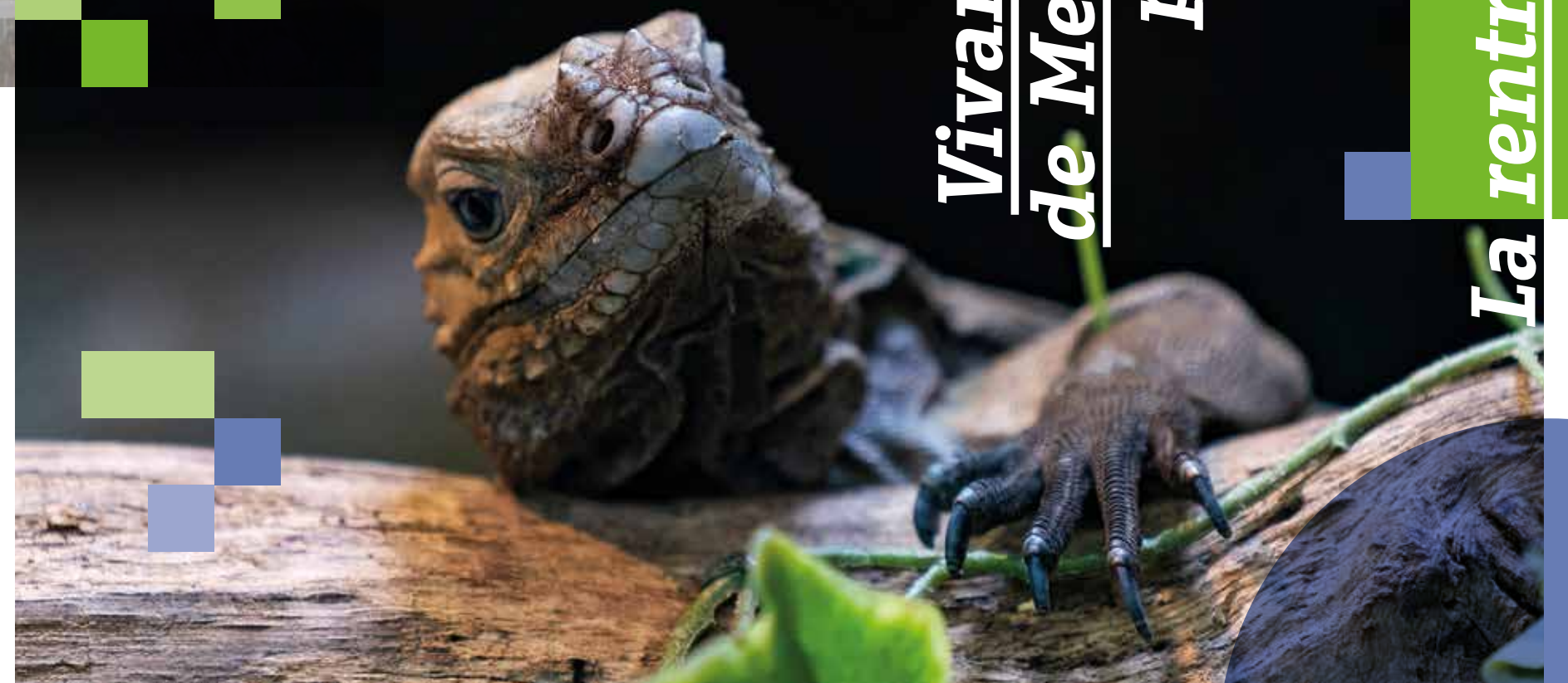
Vivarium de Meyrin p. 32

JOURNAL COMMUNAL DE MEYRIN SEPTEMBRE 2024