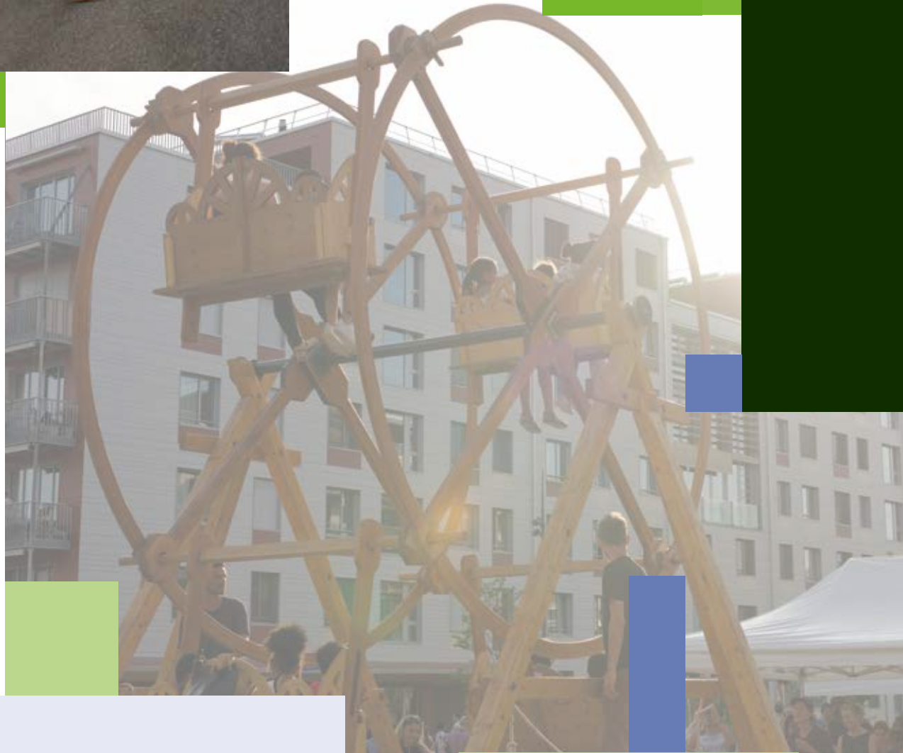
Les Vergers fêtent les 10 ans du Forum participatif p. 4