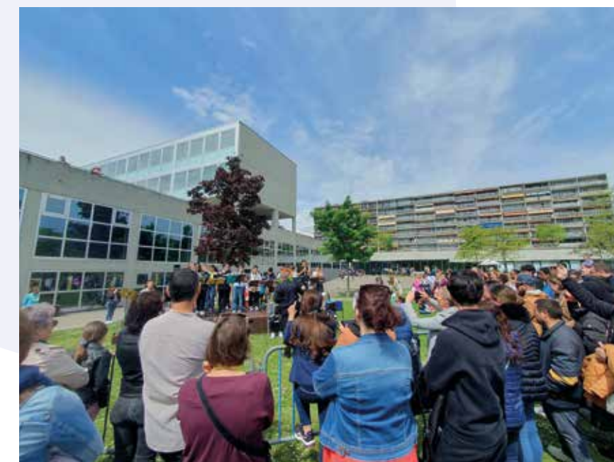
Le stand de l'association Mémoires de Meyrin lors de la fête.