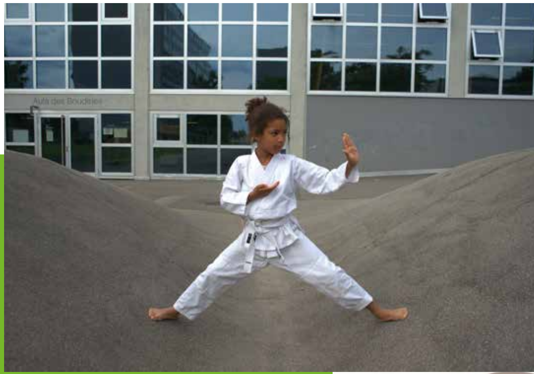
Karaté Club Meyrin p. 22