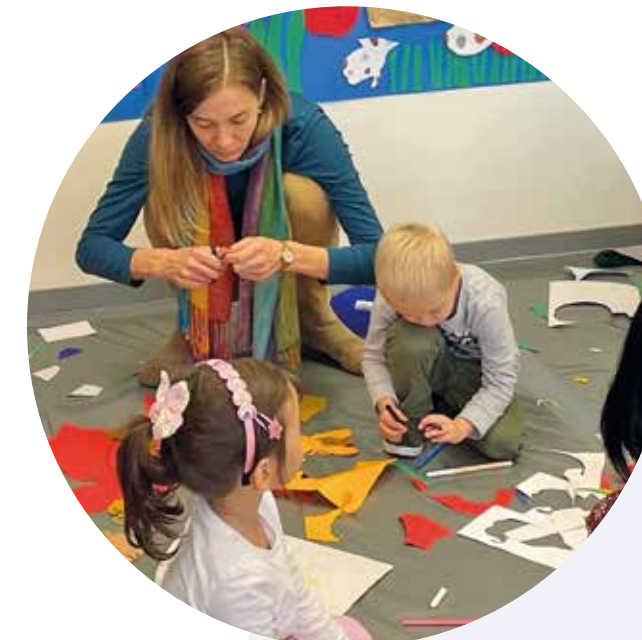
Fête des petits

Jardin de l'Amitié Rue des Lattes 43-45 0 22 782 65 11