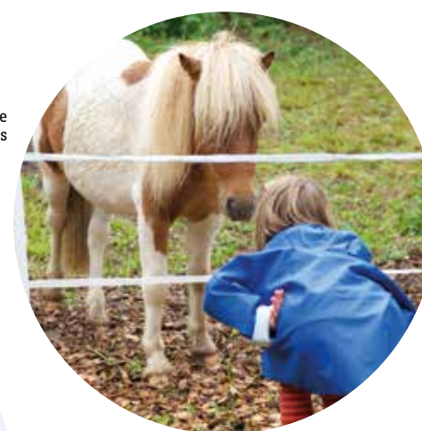
Inauguration à la ferme © François de Limoges