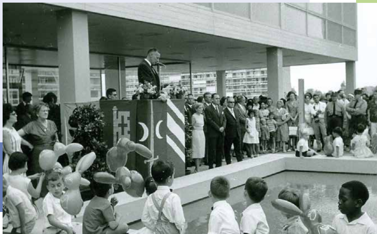
Histoire meyrinoise p. 18