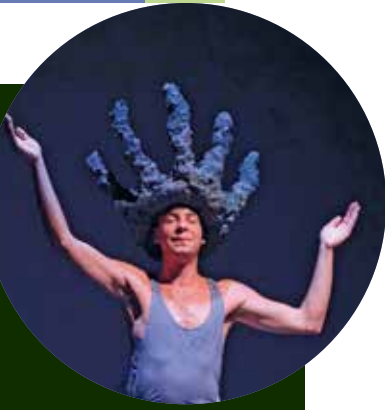
La rentrée devant soi p. 24

JOURNAL COMMUNAL DE MEYRIN SEPTEMBRE 2024