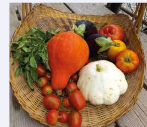
Panier 35

La Ferme des Vergers annonce ses activités de sensibilisation de cet automne. Au menu, ateliers, spectacle, visite et apéros.