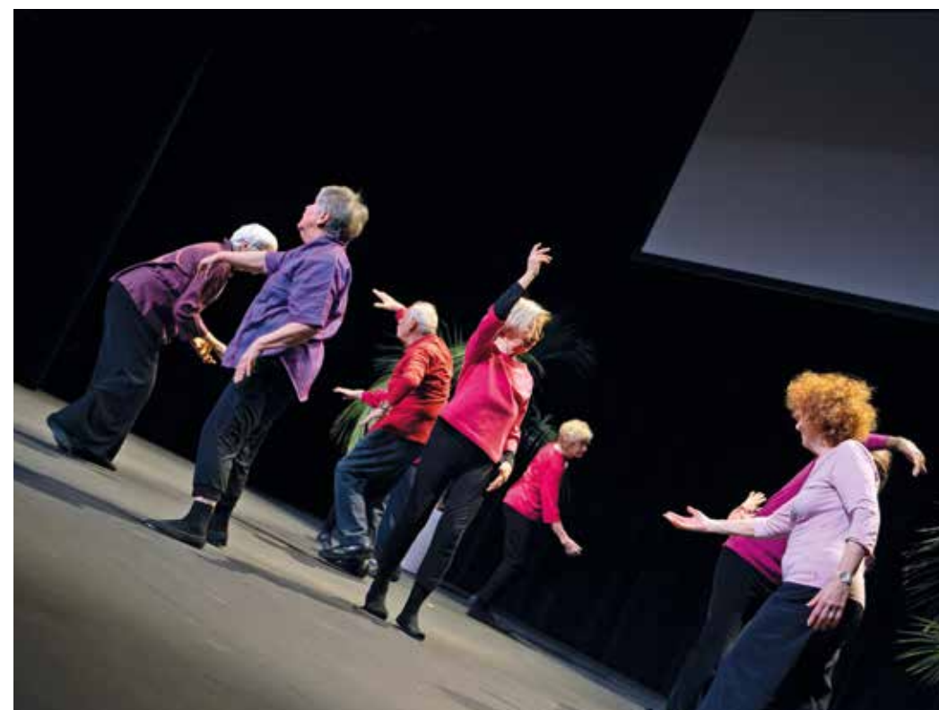
Atelier créativité et mouvement

Dès 64 ans Du 12 septembre 2024 au 26 juin 2025 (sauf vacances scolaires) Les jeudis de 10h à 11h30 Lieu: Dojo B, Ecole Bellavista 39 Av. de Vaudagne, 1217 Meyrin Tarif: CHF 20 à l'inscription Contact: Réception du Forum Meyrin 022 989 16 69