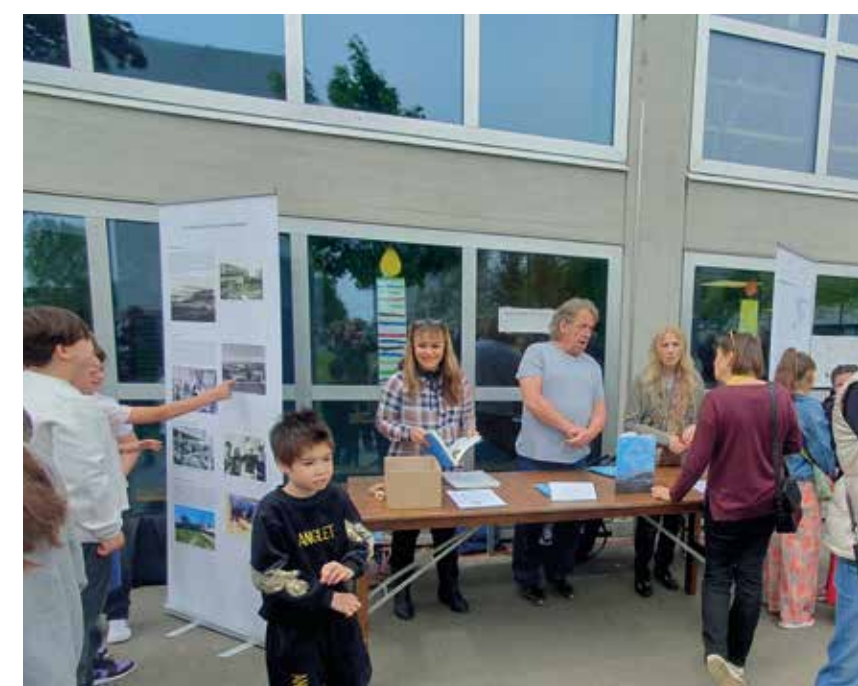
Le stand de l'association Mémoires de Meyrin lors de la fête.