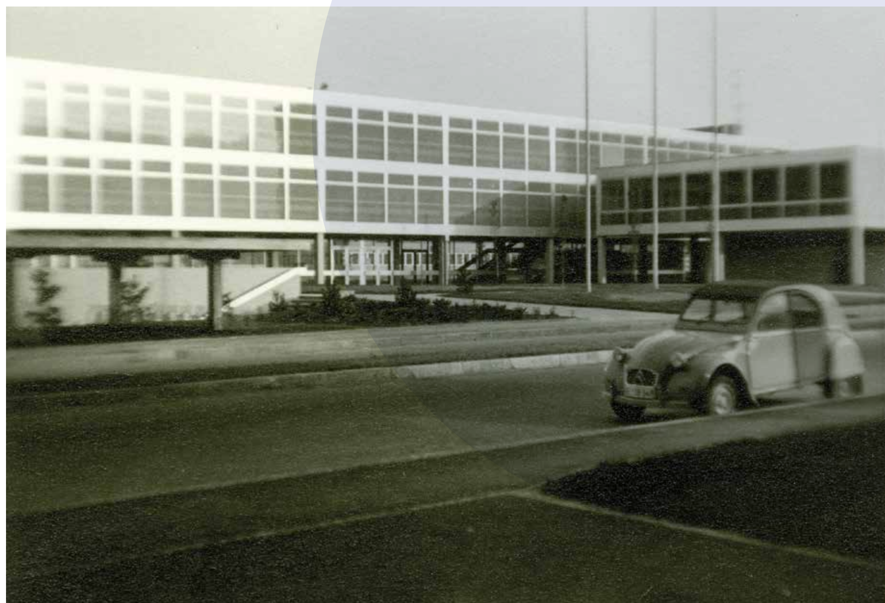
L'école des Boudines en 1965.

François Beuret revient pour nous sur son histoire, la brochure qui lui est consacrée et les festivités de mai dernier.