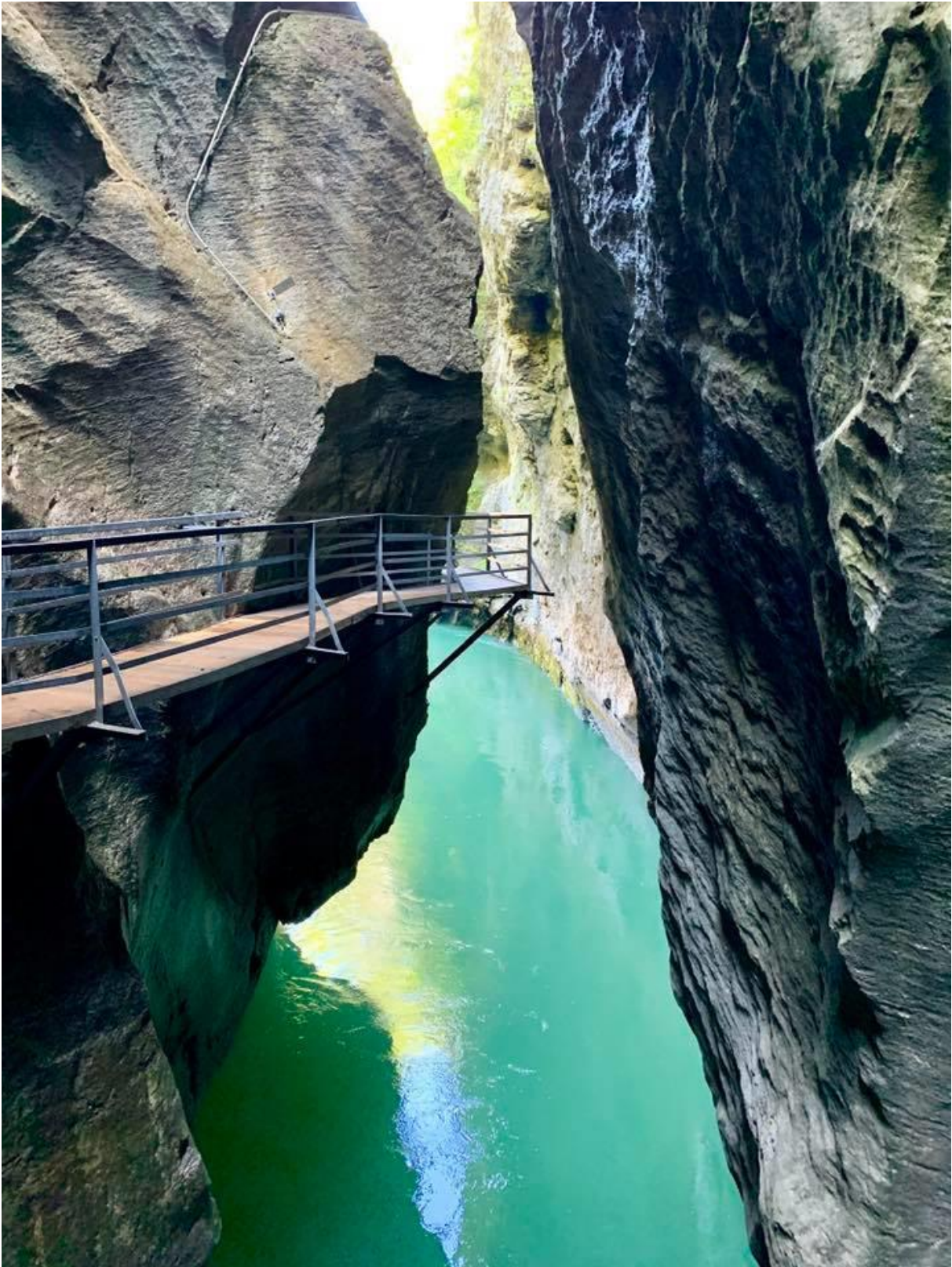
Les gorges de L'Aar