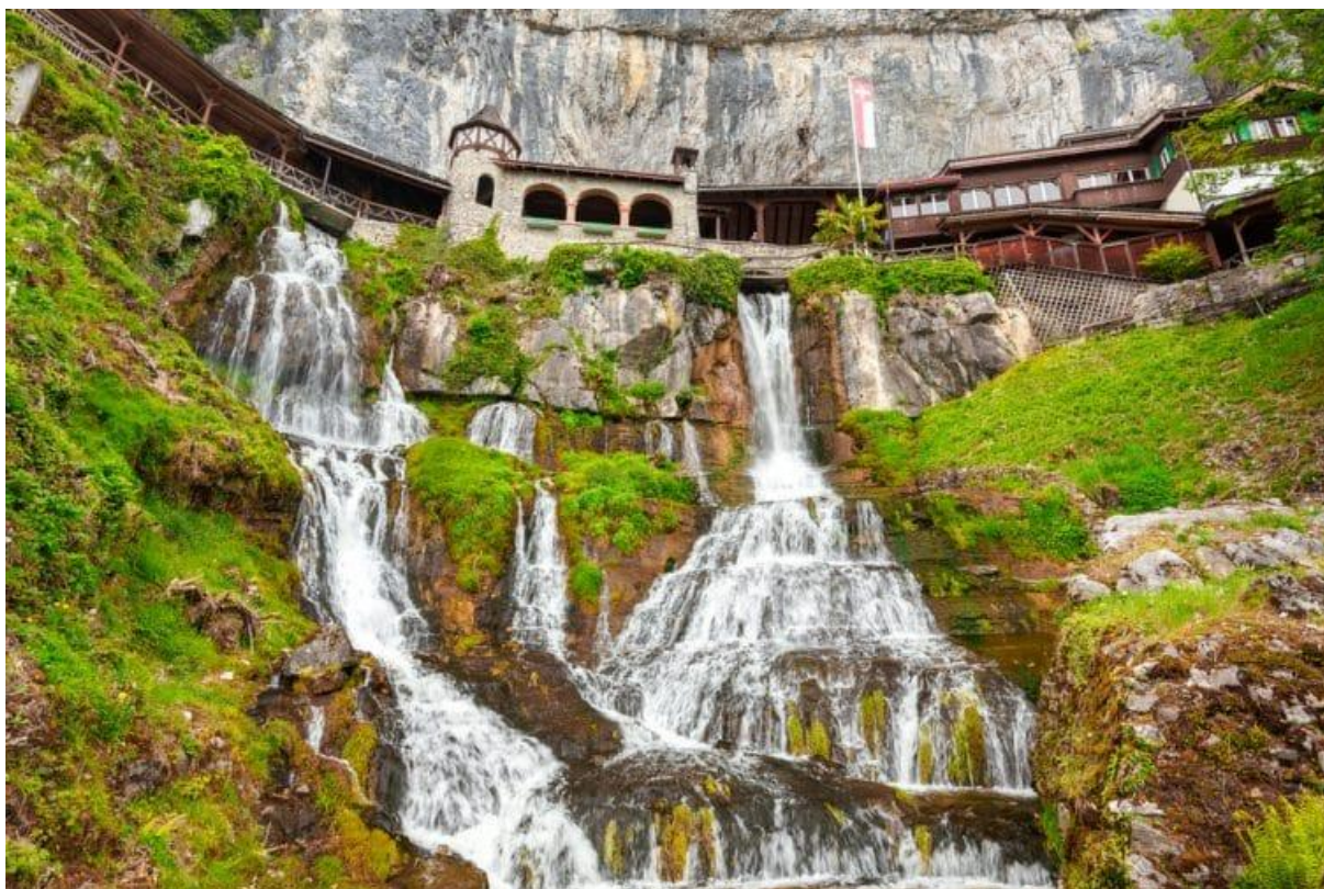
Les grottes de Beat

Présentation des propositions de sortie lors de la séance d'information (à définir sur place).