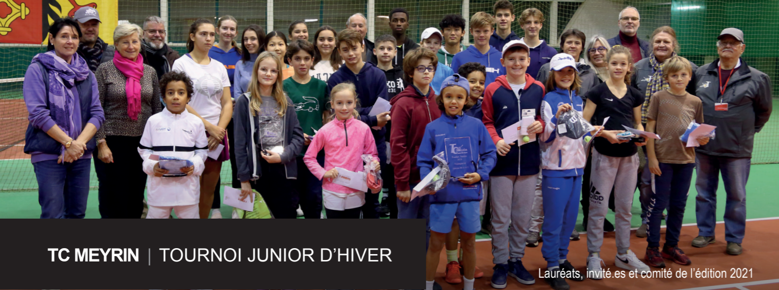
TC MEYRIN | TOURNOI JUNIOR D'HIVER