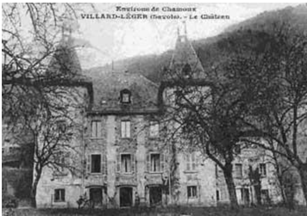
Le château de St Bon à Villard-Léger (73) en 1900, du vivant du comte Alexis. Maison forte du XVe s., agrandie à la fin du XVIIIe.