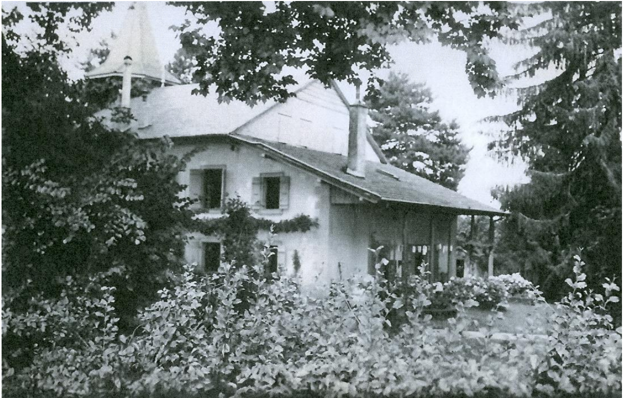
La propriété St Bon à Meyrin, devenue la campagne Gabus.