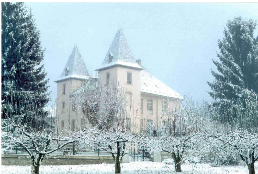
Le château en 2001.