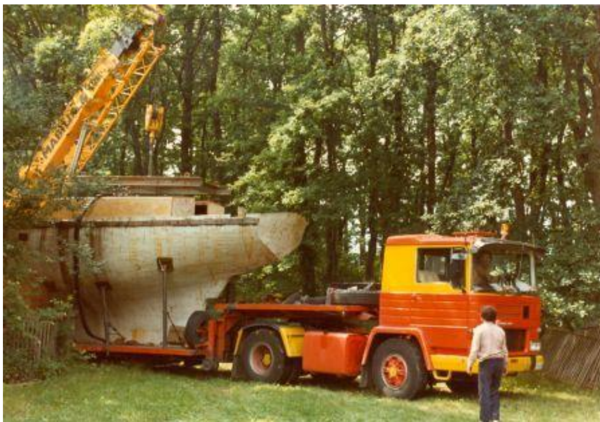
Evacuation du bateau, juin 1982

Dès 1977, la Commune confie la gestion du terrain à l'Association du Terrain Jakob qui a été officiellement fondée le 15 décembre 1976 et dont les buts sont l'animation et l'exploitation du Terrain Jakob pour l'ensemble de la population meyrinoise. L'utilisation du Terrain Jakob est donc étendue à d'autres activités que la Colonie journalière et rendue possible toute l'année. Il s'agit alors pour la nouvelle association d'aménager la maison et de consolider ses dépendances. En 1981, la maison est rénovée. En juin 1982, le Terrain Jakob est le théâtre d'une opération particulière : l'évacuation d'un bateau ! En effet, depuis plusieurs années, déjà du temps de M. Trachsler, une partie du terrain était mis à disposition d'un particulier qui y construisait des bateaux. Mais le « chantier naval » ayant été abandonné, il était devenu nécessaire pour des raisons de sécurité d'évacuer l'embarcation non achevée.